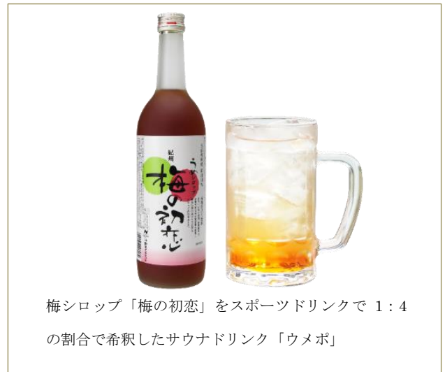
梅シロップ「梅の初恋」をスポーツドリンクで1:4の割合で希釈したサウナドリンク「ウメポ」