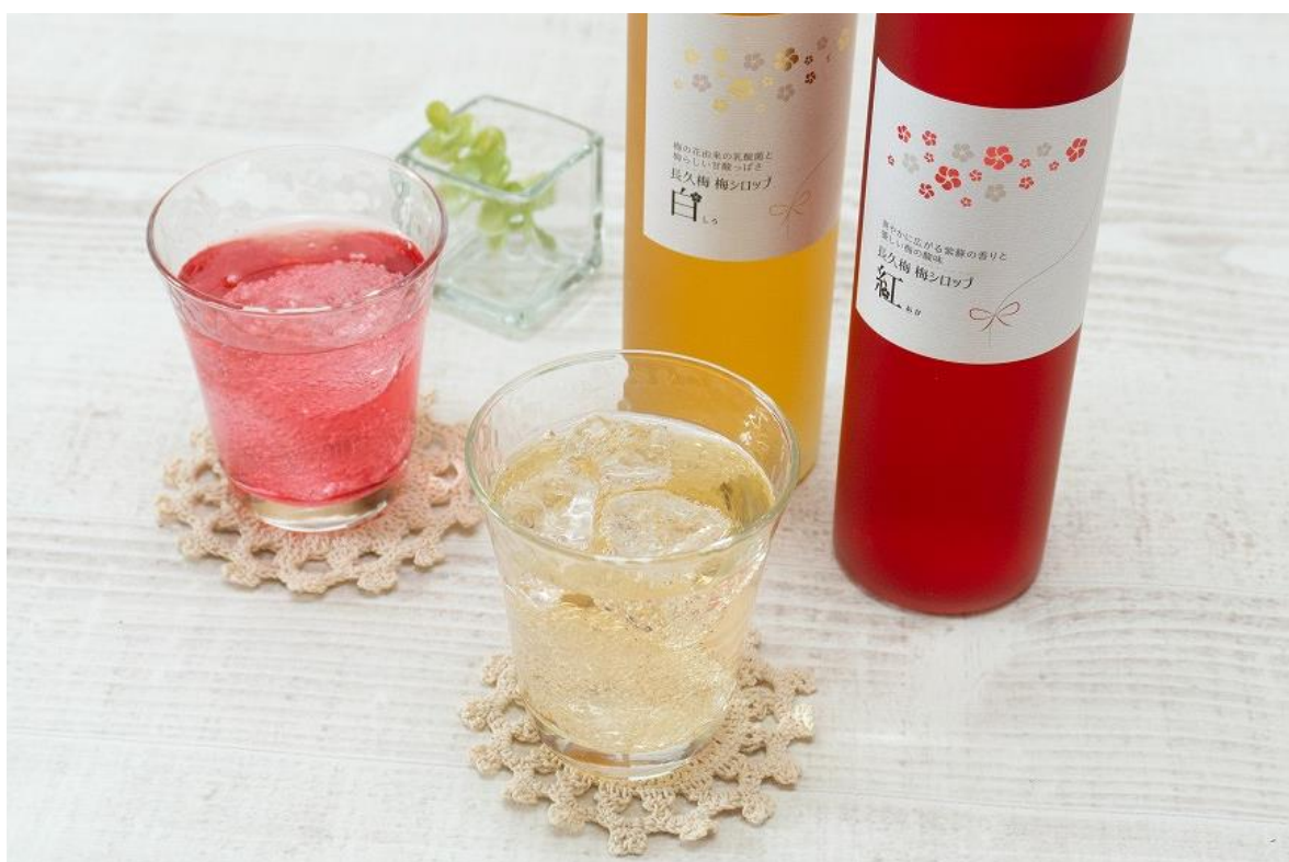
左：長久梅 梅シロップ白 右：長久梅 梅シロップ紅（あか）